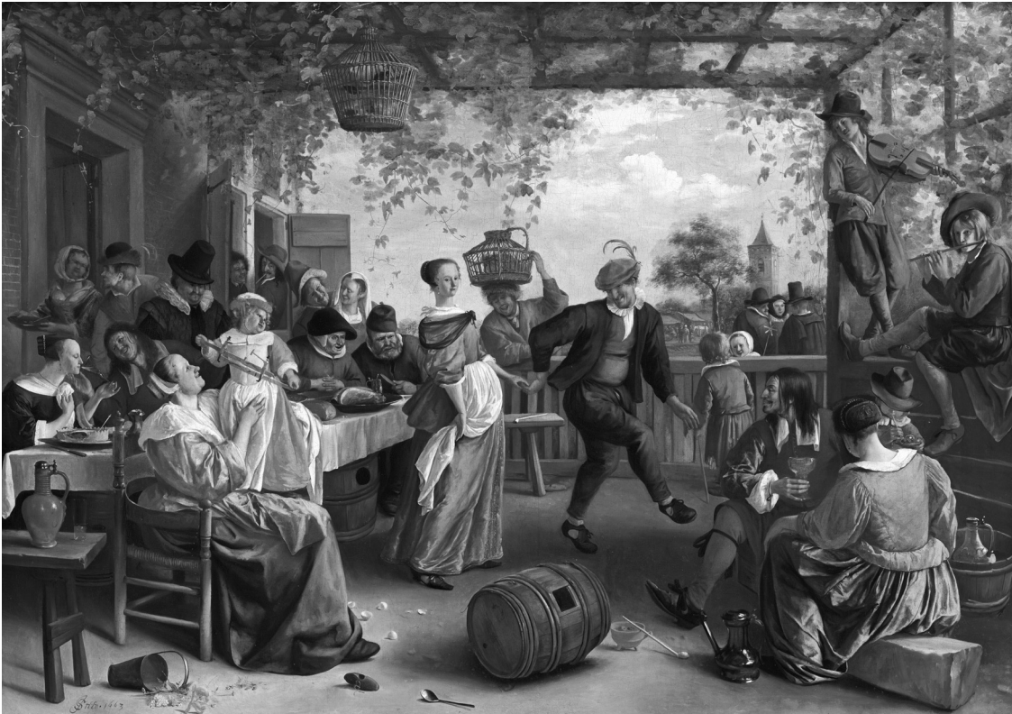
Картина Яна Стена «Пара, що танцює», 1663 р. У Нідерландах гумористичний вислів «господарство Яна Стена» означає дім, у якому панує безлад, проте весело