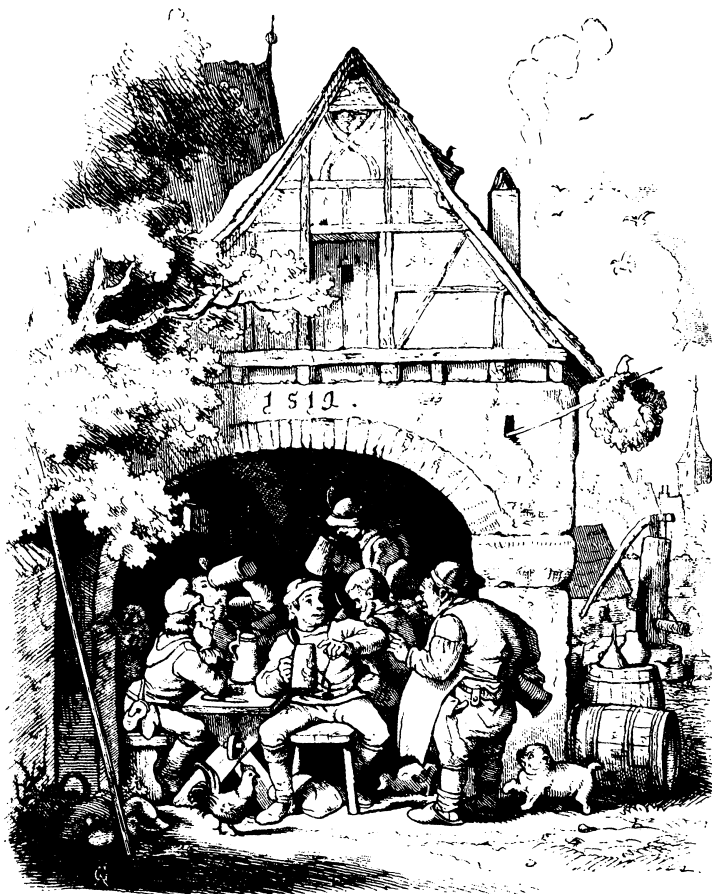
Весела компанія в шинку. Ксилографія Людвіга Ріхтера, XIX ст.

Чи потреба сп'яніти є реакцією людини на те, що вона усвідомила себе і свою смертність? Ми не тварини, не боги і до- стеменно не знаємо, як би прожили своє життя. Чи сп'яніння – місце спочинку під час пошуків сенсу нашого існування? Чи це спосіб викинути з голови гнітючі роздуми про насущні життєві питання?